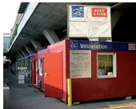
Velostation beim Bahnhof Luzern

Im Caritas-Betrieb Littau werden defekte Fahrräder demontiert. Die Einzelteile gelangen per Container zu Partnerbetrieben nach Afrika, wo sie wieder bedarfsgerecht als Velos zusammengebaut werden. Gut erhaltene Fahrräder kommen in den Caritas-eigenen Secondhand-Läden in den Verkauf. ■