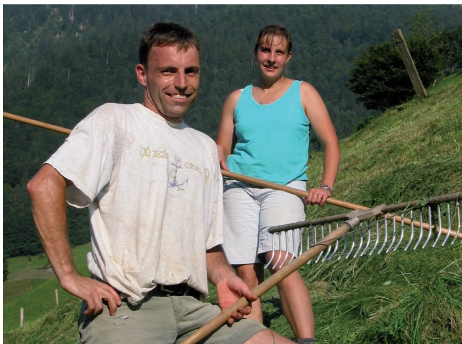
Kulturaustausch zwischen zwei sehr unterschiedlichen Lebensweisen: Bergbauer und Freiwillige.

Bei den «Caritas-Bergeinsätzen» unterstützen Freiwillige in Not geratene Bergbauernfamilien bei der täglichen Arbeit auf dem Hof.