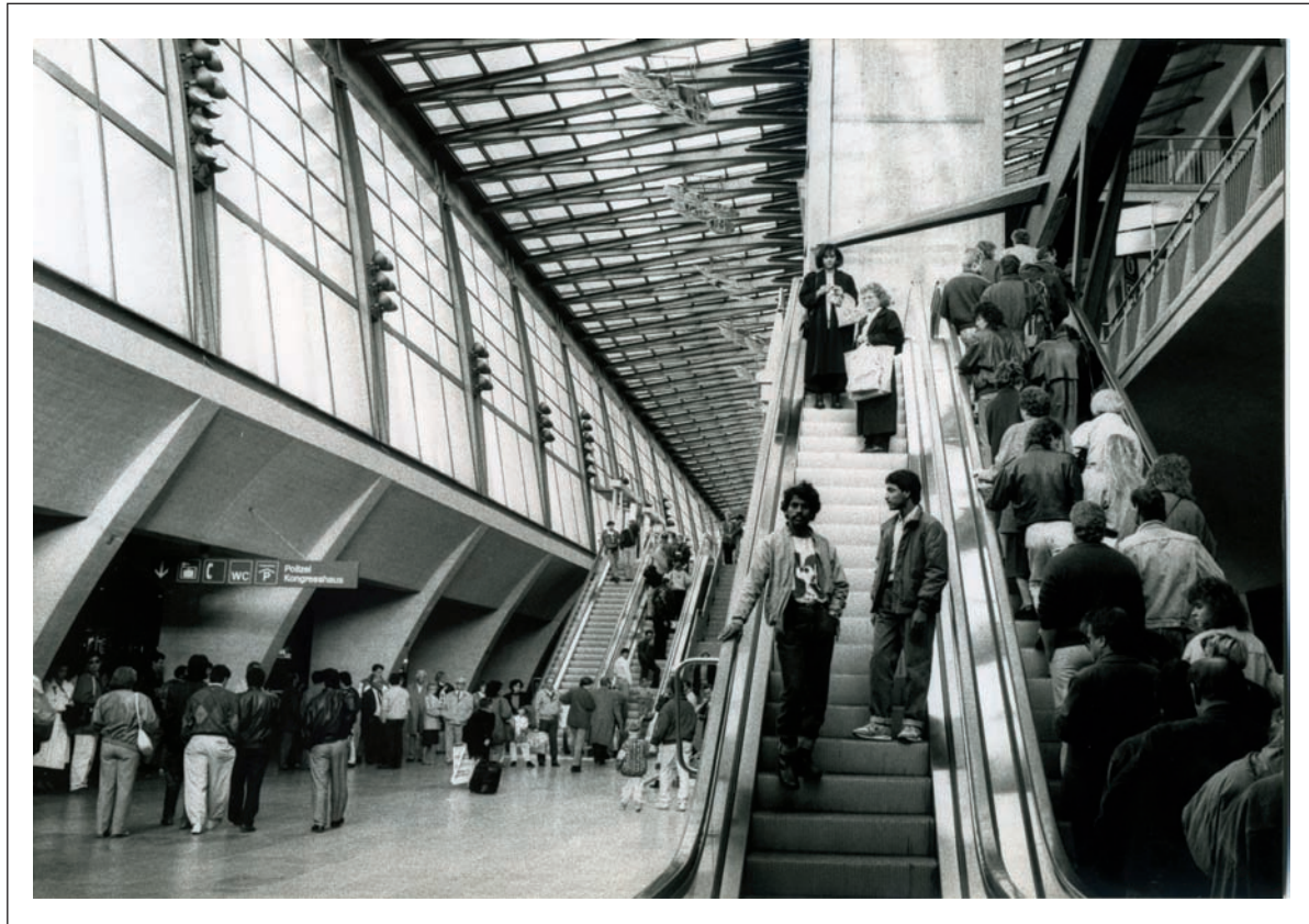
Bahnhof Luzern um 1991

Als anfangs der 1980er-Jahre die ersten Menschen aus Sri Lanka vor dem Bürgerkrieg flohen und in die Schweiz kamen, hatten viele Angst vor den dunkelhäutigen Menschen, die oft am Bahnhof anzutreffen waren. Man bezeichnete sie als Wirtschaftsflüchtlinge, die hier nur profitieren wollten. Heute schätzt man sie gerade im Gastgewerbe – weil sie jene Arbeit machen, für die andere sich zu schade sind.